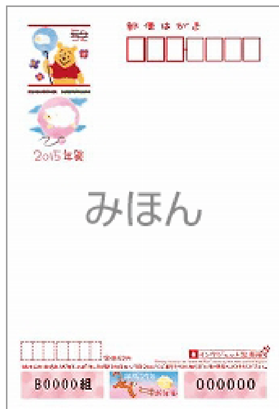
⑥ディズニーキャラクター (インクジェット写真用)