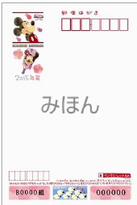
⑤ディズニーキャラクター (インクジェット)