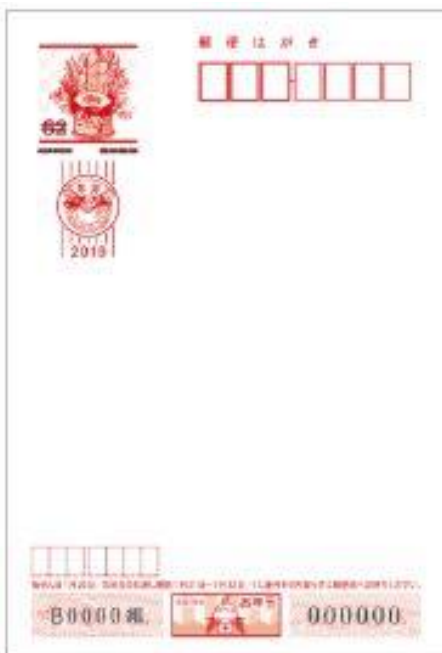
④無地 ⑤無地 (くぼみ入り)