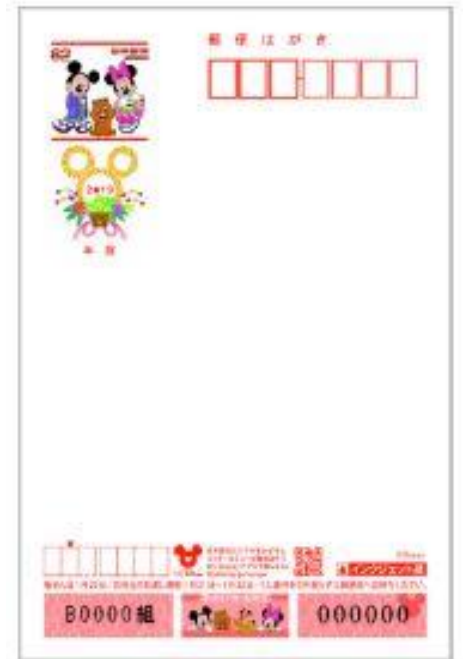
②ディズニー年賀 (インクジェット)