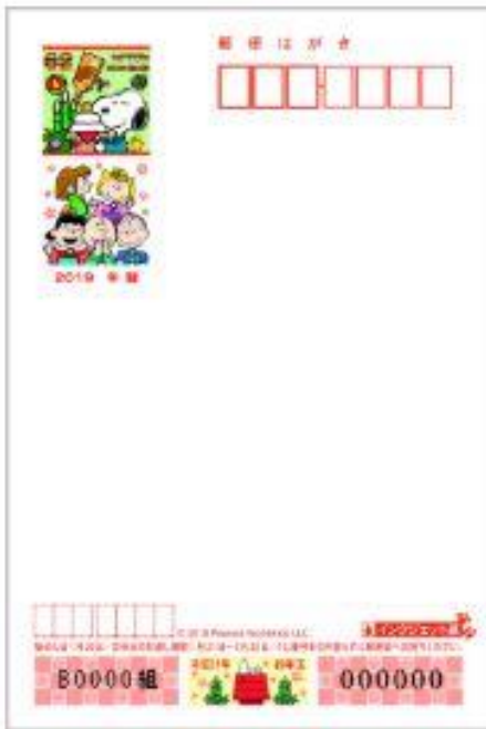
①スヌーピー年賀 (インクジェット)