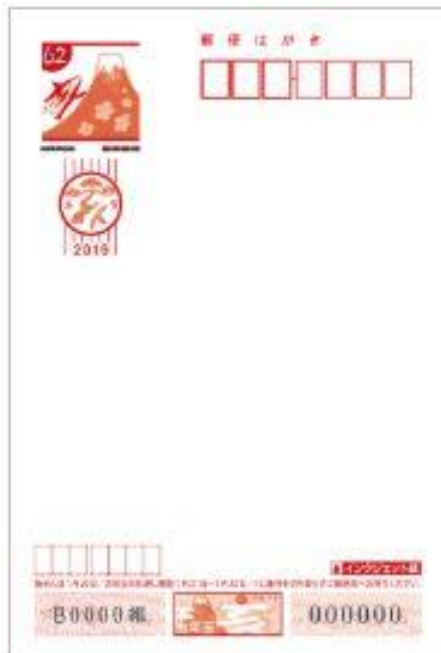
⑥無地 (インクジェット)