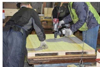
(右)パレットの生産現場