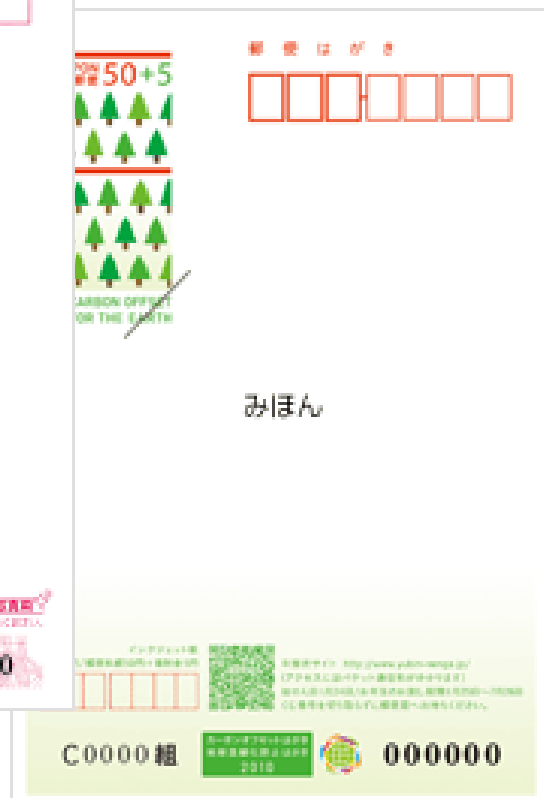
カーボンオフセット インクジェット