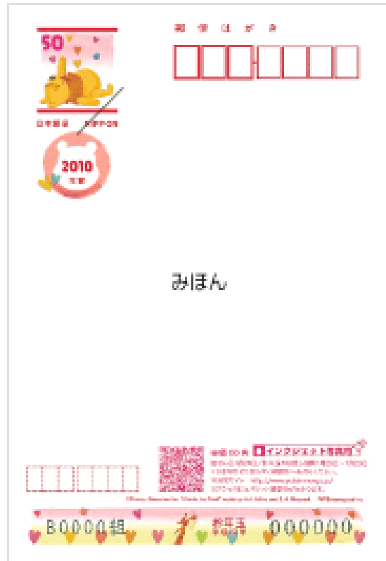
ディズニーインクジェット写真用