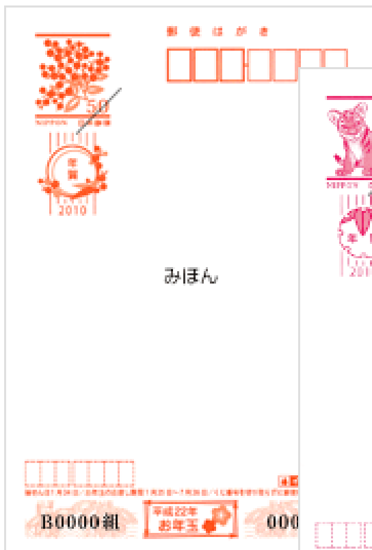
無地・インクジェット