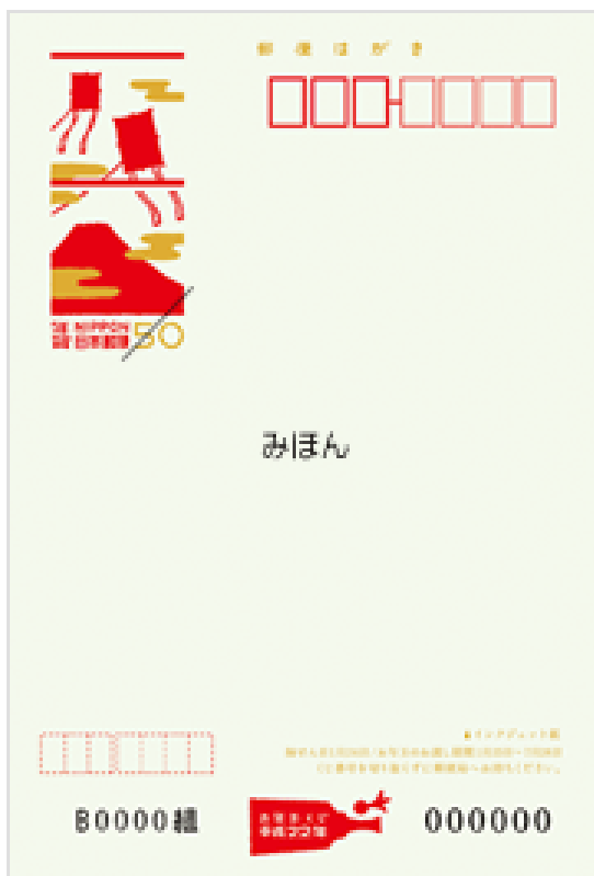
いろいろ (うぐいす)