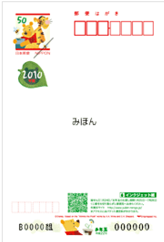
ディズニーインクジェット