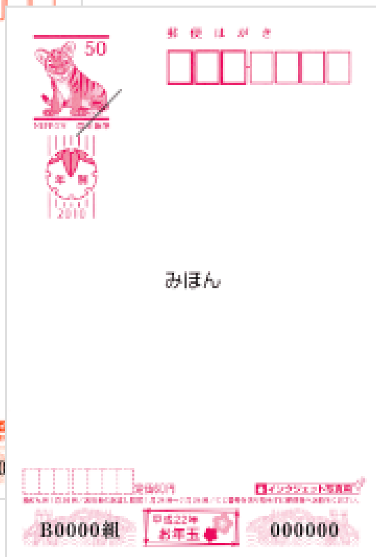
インクジェット写真用