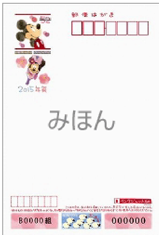
⑤ディズニーキャラクター (インクジェット)