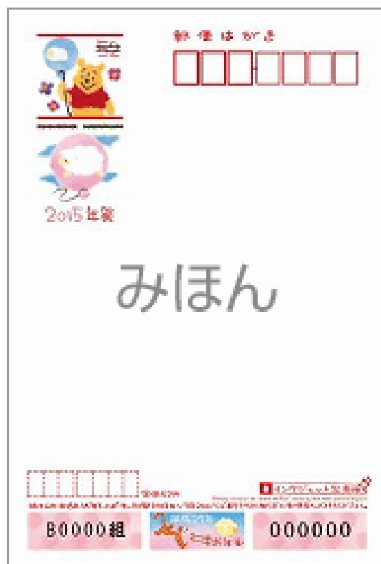
⑥ディズニーキャラクター (インクジェット写真用)