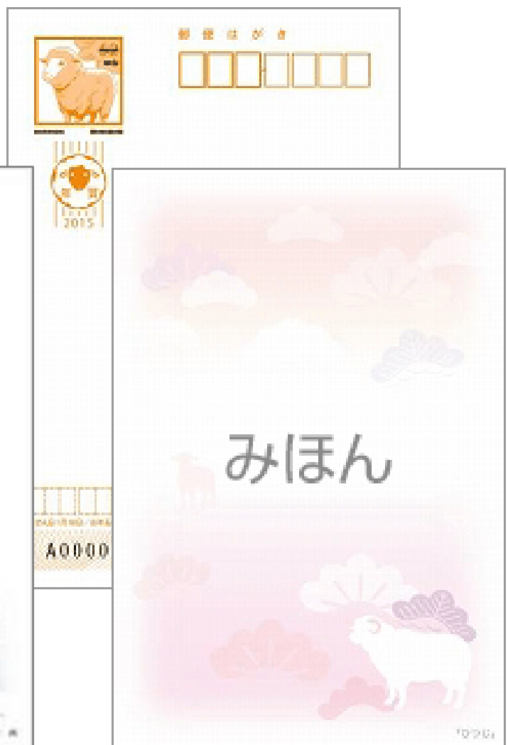
⑩絵入り「寄付金付」 全国版・ひつじ