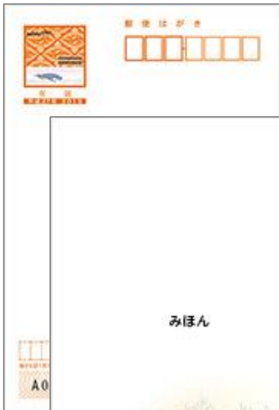
⑨絵入り「寄付金付」 北海道版・旭山動物園のペンギン