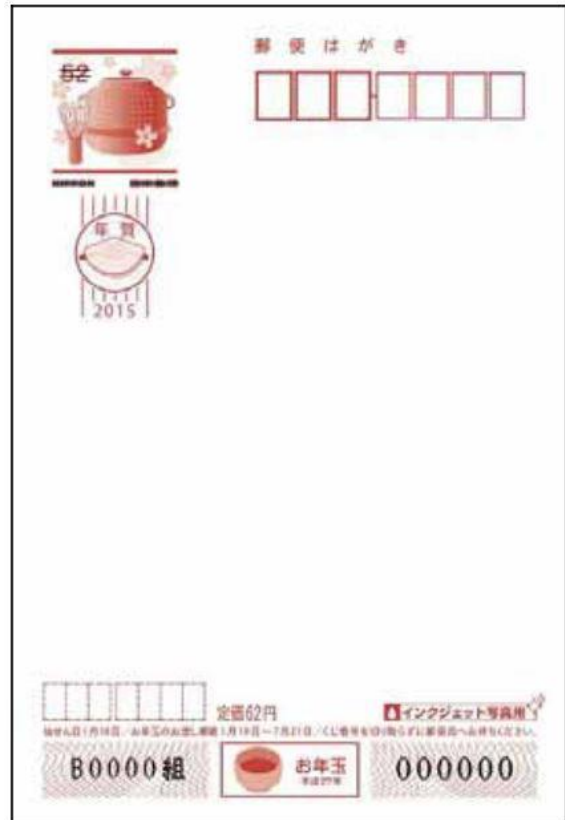
③無地インクジェット写真用