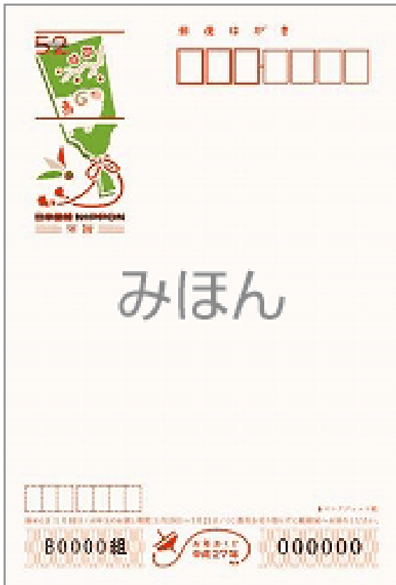
⑦いろいろ年賀 (もも/インクジェット)