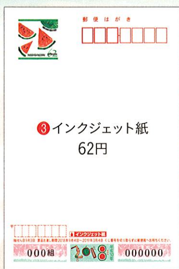
③ インクジェット紙 62円