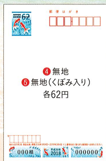
④ 無地 ⑤ 無地(くぼみ入り) 各62円