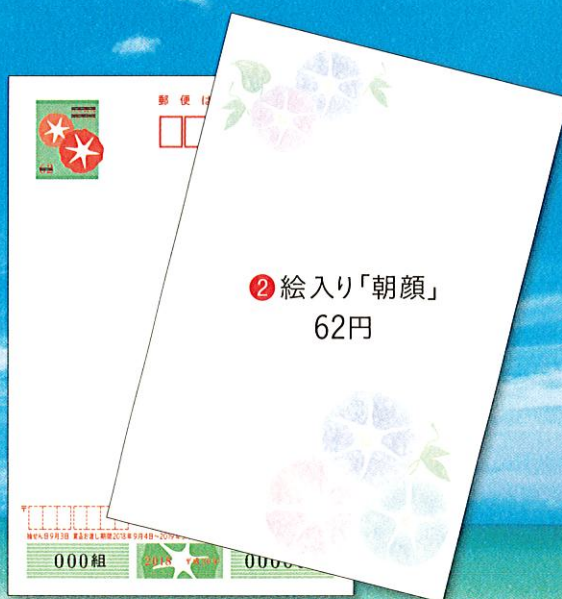
② 絵入り「朝顔」 62円