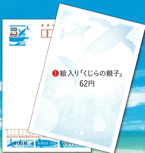
① 絵入り「くじらの親子」 62円