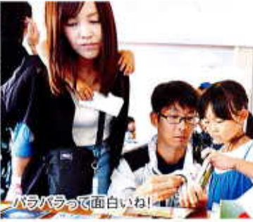
パラパラって面白いね!