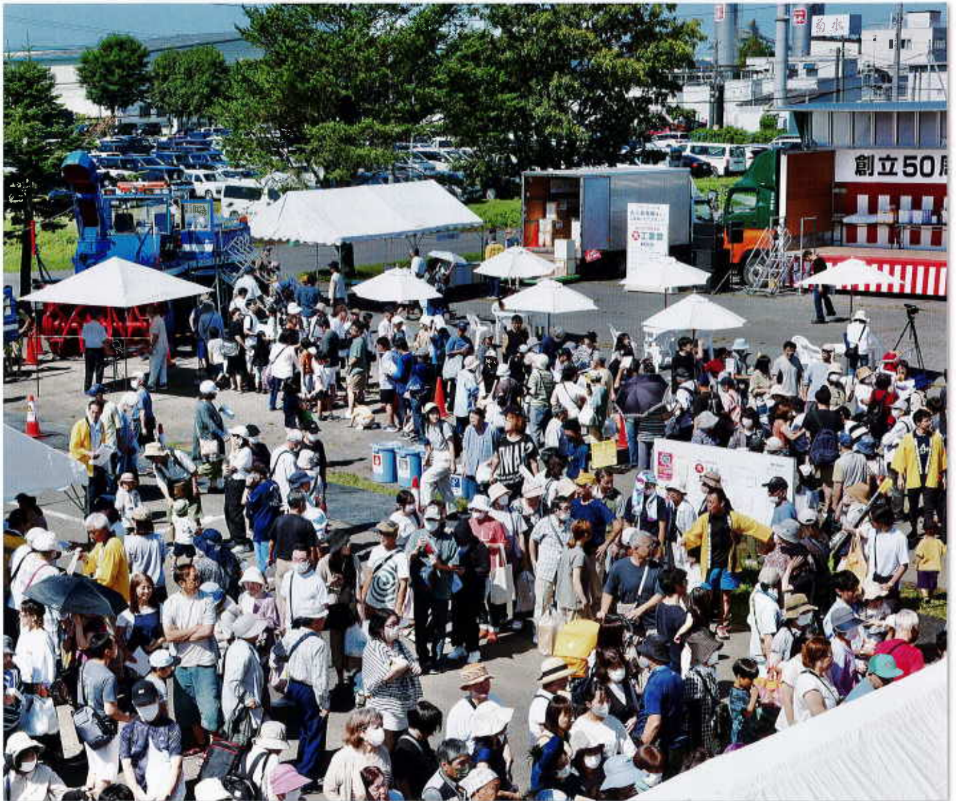
9月1日 組合創立50周年記念・大工業祭会場

*広報「ついでしかり」の名称は、江別の発祥の地「対雁」(現在の工業団地周辺)の地名からとったものです。