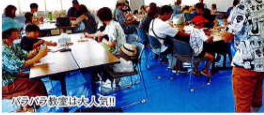
パラパラ教室は大人気!!