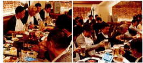
写真は昨年の様子です。