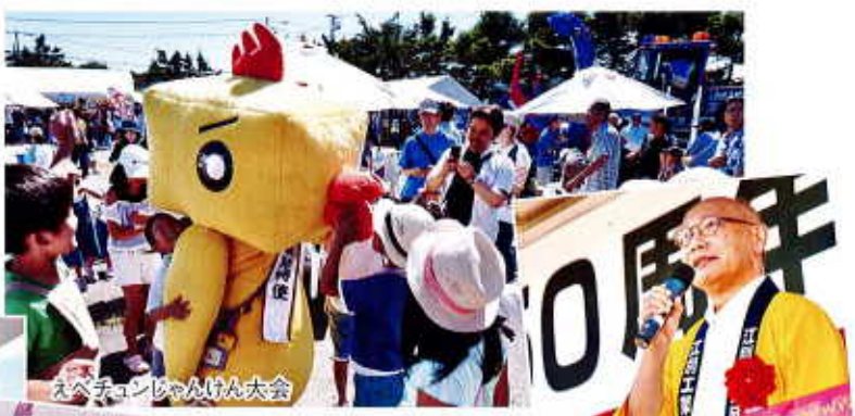
えべチンじゃんけん大会

会場には子供たちの列が並び、勝ち負け関係なく団地内商品をお持ち帰りいただきました。