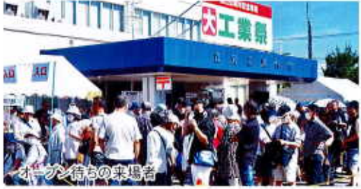
オープン直後の来場者

杉野理事長、龍田副理事長、佐々木実行委員長、衆議院議員 和田義明様、江別市長 後藤好人様の挨拶後、テープカットと同時に打ち上げ花火の合図で大勢の方が来場。