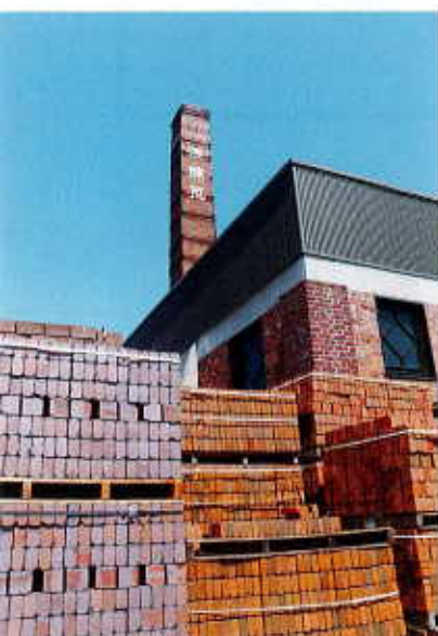
△工場のシンボル煉瓦煙突