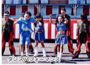
ダンスパフォーマンス

江別市内のダンスチーム(4チーム)によるダンスショーを披露していただきました。小学生から大人まで年齢関係なしのグループで、ヒップホップやマイクパフォーマンスをしながらのダンス。 午前と午後の2回の出演、高い柔軟性とパフォーマンスを発揮していただきました。