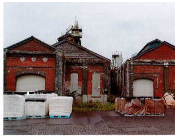
△明治のれんが倉庫、威風堂々と立ち並ぶ。