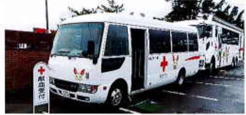
写真は昨年の様子です。